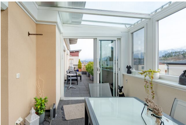
Wintergarten - Loggia