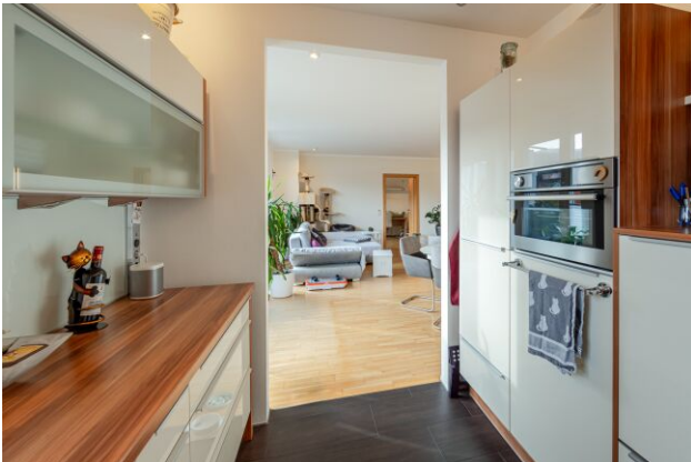
Küche mit Blick Richtung Wohnzimmer