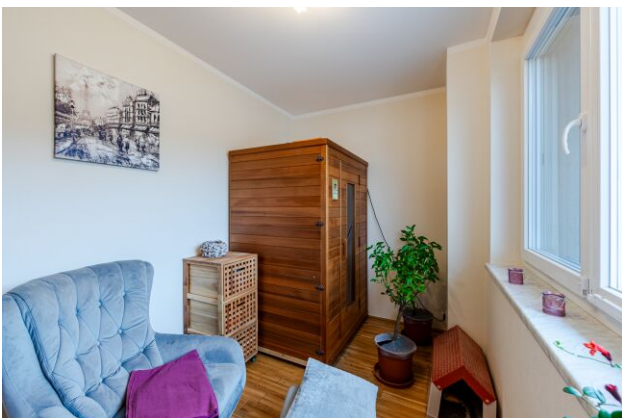
Hobbyraum mit Infrarot-Sauna