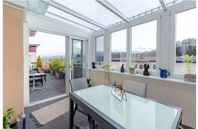
Wintergarten - Loggia