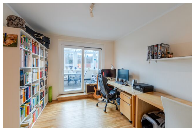
Arbeitszimmer mit Blick in Richtung Loggia