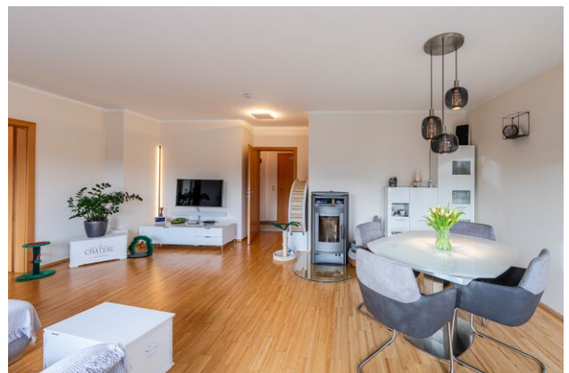
Wohnzimmer mit schwedischem Ofen