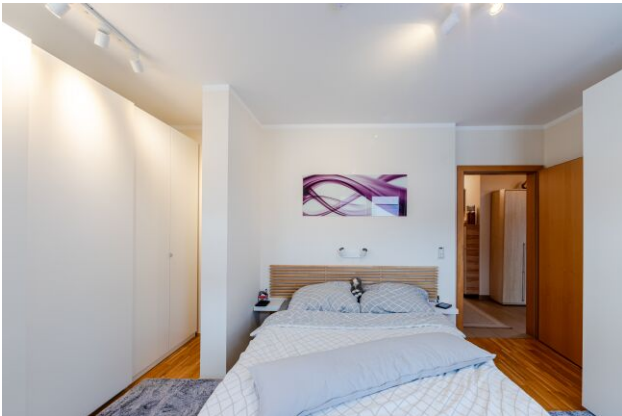
Schlafzimmer mit begehbarem Schrank