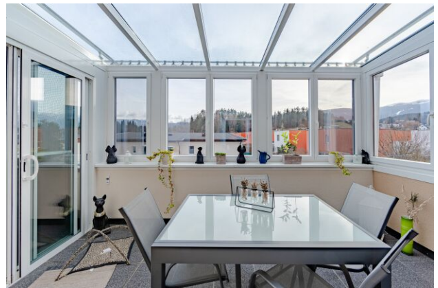
Wintergarten - Loggia