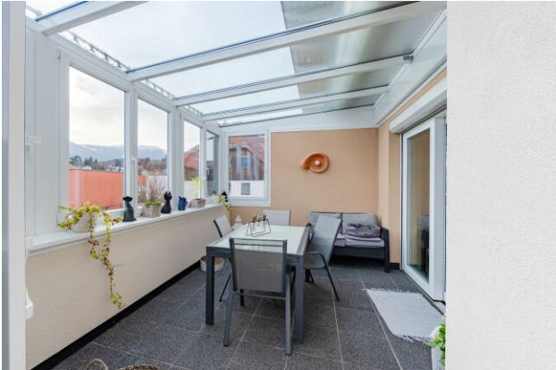
Wintergarten - Loggia