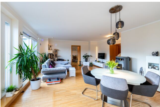
Wohnzimmer mit Essecke