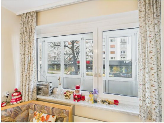
Blick Küche auf Loggia.