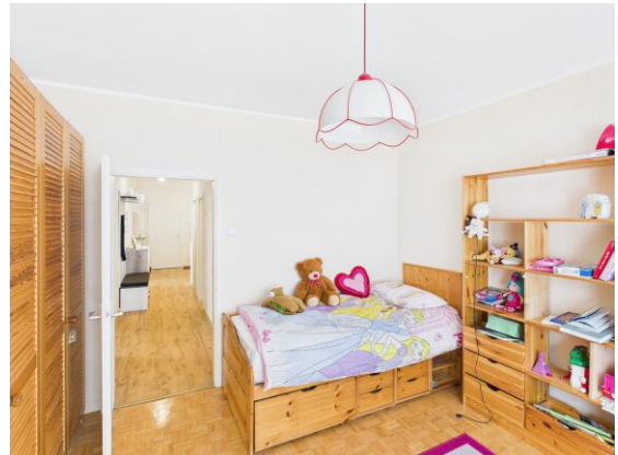
Kinderzimmer / Arbeitszimmer.