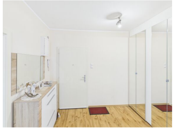
Eingangsbereich / Vorraum.