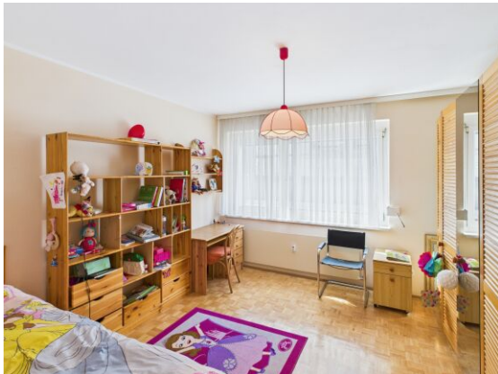
Kinderzimmer / Arbeitszimmer.