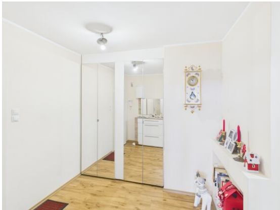
Vorraum inkl. Einbauschränk.