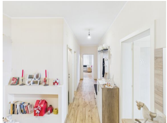
Vorraum. Räume zentral begehbar.