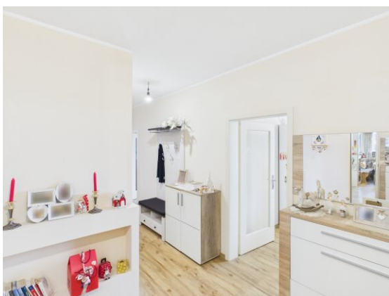
Vorraum. Zugang Küche.