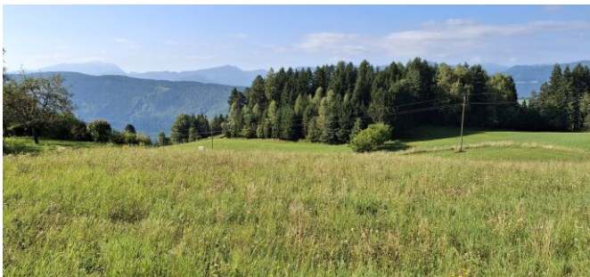
Blick Richtung Süden mit Seesicht