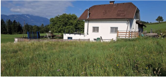
Blick Richtung Westen