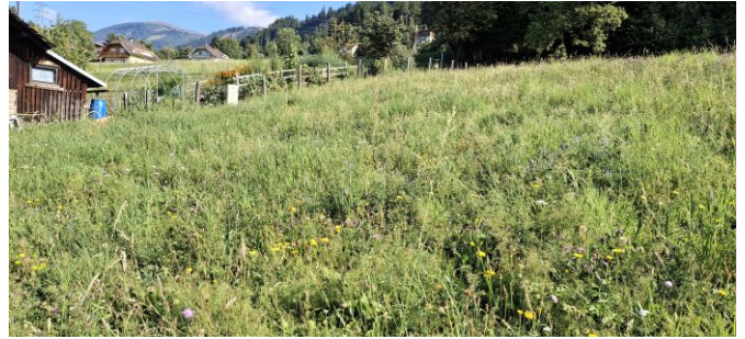
Blick Richtung Nordwesten