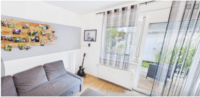
Wohnzimmer mit Ausblick Garten