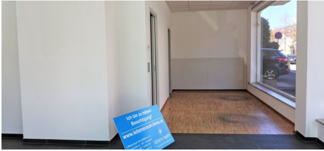
Verkaufsraum - Geschäftslokal - Spittal/Drau - mieten