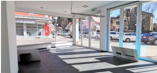
Empfangsbereich/Verkaufsraum - Geschäftslokal - Spittal/Drau - mieten