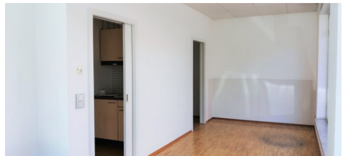
Verkaufsraum - Geschäftslokal - Spittal/Drau - mieten