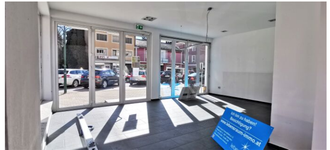
Empfangsbereich/Verkaufsraum - Geschäftslokal - Spittal/Drau - mieten