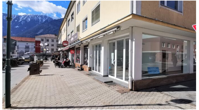
Geschäftslokal - Spittal/Drau - mieten - Schaufensterauslage